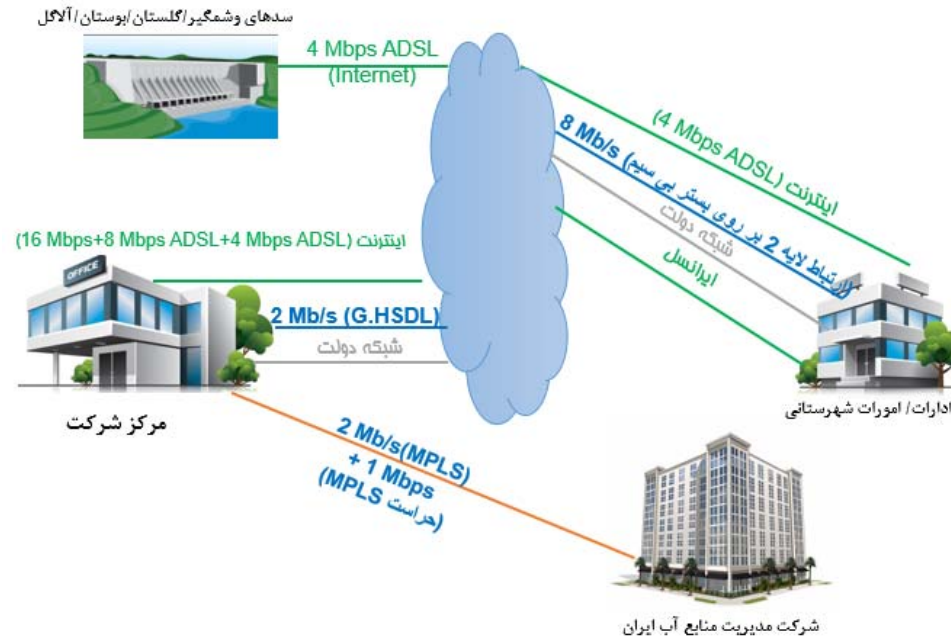
شمای تصویری شبکه ارتباطی و اختصاصی